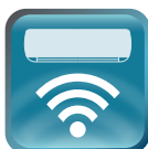
Wi-Fi управление сплит-системой