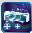
Мощная плазменная очистка воздуха PLASMA LUX

Внутренние блоки серии LUX Design SUPER DC Inverter оснащены 7-скоростными вентиляторами, что дает возможность гибкой настройки скорости воздуха — от легкого дуновения до сильного потока, способного за короткое время охладить или согреть помещение.